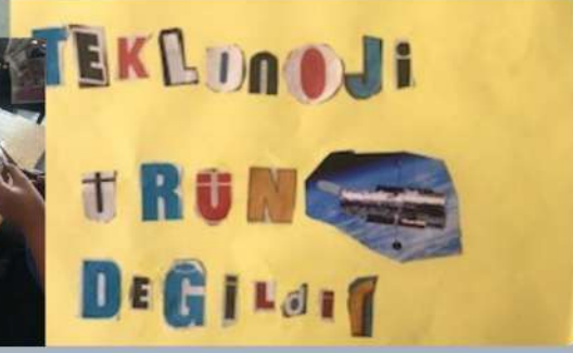
Teknoloji ve Tasarım