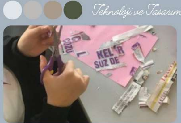
Teknoloji ve Tasarım